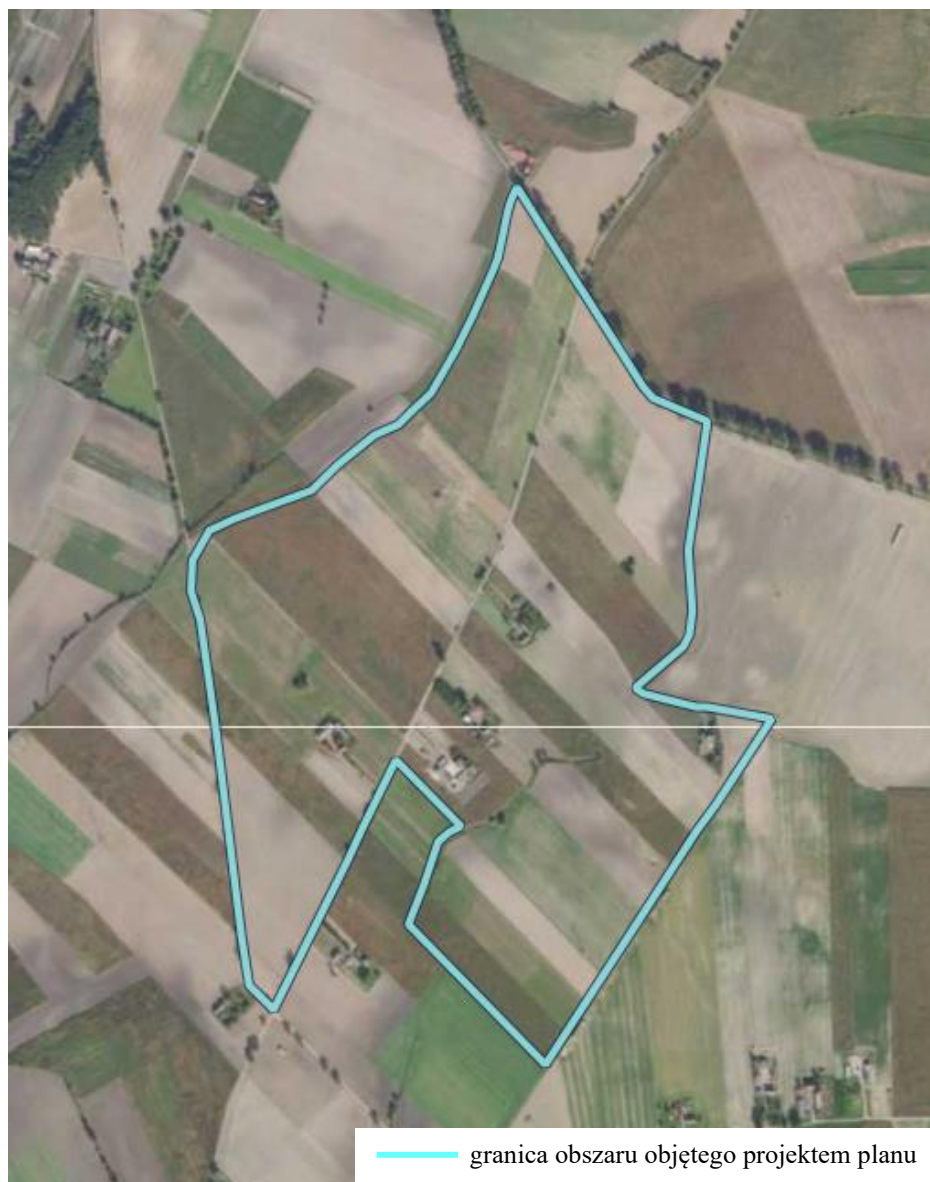
Ryc. 1. Lokalizacja obszaru objętego projektem planu na tle ortofotomapy

Obszar opracowania projektu planu położony jest w gminie Duszniki w obrębach geodezyjnych Brzoza i Ceradz Dolny. Jego powierzchnia wynosi ok. 78 ha. Przedmiotowy teren jest zdecydowaniej większości niezainwestowany (Ryc. 1.), występuje zabudowa związana z prowadzeniem gospodarstw rolnych. W sąsiedztwie przedmiotowego obszaru występują tereny użytkowane rolniczo oraz tereny zabudowy zagrodowej w gospodarstwie rolnym.