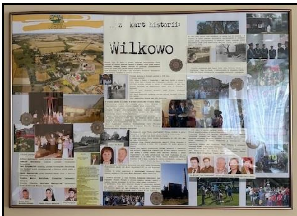
Wilkowo – aktywna i zintegrowana społeczność

ZASOBY – wszelkie elementy materialne i niematerialne wsi i związanego z nią obszaru, które mogą być wykorzystane obecne bądź w przyszłości w realizacji publicznych bądź prywatnych przedsięwzięć odnowy wsi. Zwrócić uwagę na elementy specyficzne i rzadkie (wyróżniające wieś). Opracowanie: Ryszard Wilczyński