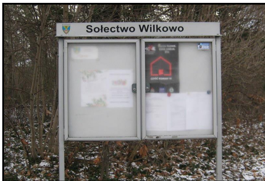
Tablica informacyjna sołectwa

SOŁECKA STRATEGIA ROZWOJU – WILKOWO wypracowana przez GOW na warsztatach w ramach programu UMWW - „Wielkopolska Odnowa Wsi 2020+”