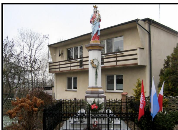
Miejsce kultu religijnego