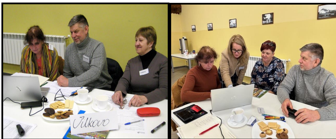
Grupa Odnowy Wsi w czasie warsztatów opracowania Sołeckiej Strategii Rozwoju Świetlica wiejska w Chraplewie w dniach 12-13.I.2024 r.

SOŁECKA STRATEGIA ROZWOJU – WILKOWO wypracowana przez GOW na warsztatach w ramach programu UMWW - „Wielkopolska Odnova Wsi 2020+”