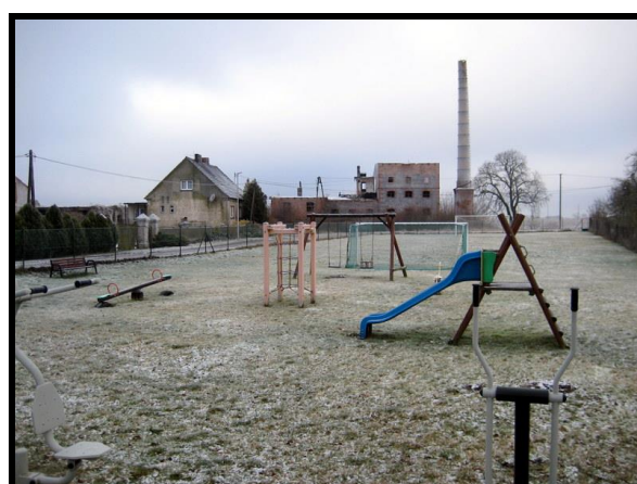
Miejsce sportu i rekreacji