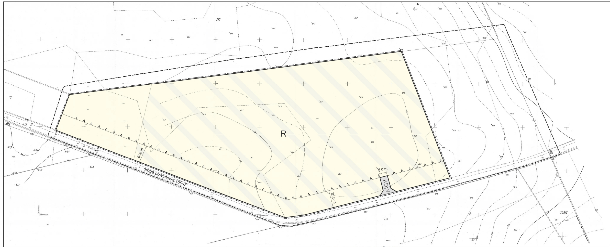
Wyrys ze studium uwarunkowań i kierunków zagospodarowania przestrzennego gminy Duszniki

--- granica obszaru objętego planem skala 1 : 10 000