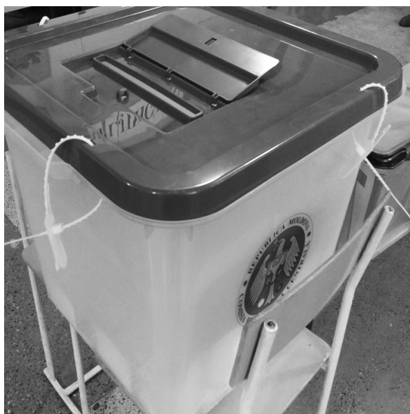
Zdjęcie 1. Nieumiejętnie zaplombowana urna wyborcza w wyborach na Prezydenta Republiki Mołdawii – listopad 2016 roku