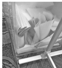
Zdjęcie 4. Dosypane głosy w prawyborach rosyjskich w 2016 roku. Autor: Vladimir Egorov

Warto wiedzieć, jak taką wrzutkę rozpoznać. Zadaniem jest ułatwić transparentne urny, przez które widać rozkład kart we wnętrzu. W normalnej sytuacji, gdy wyborcy opuszczają głosy do urny pojedynczo, karty do głosowania rozsypują się. Kiedy mamy do czynienia z wrzutką głosów, karty są zazwyczaj ułożone równomiernie, tworząc pliki papieru, pliki kart do głosowania.